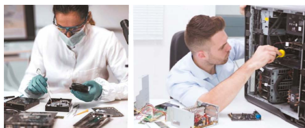
Рис. 5. Проведение компьютерно-технической экспертизы. Fig. 5. Carrying out computer technical examination.

Учитывая, что компьютерно-технические экспертизы не всегда могут раскрыть полную картину преступлений, использование возможностей чипов могло бы восполнить недостающие части. С помощью чипов можно осуществлять контроль за сотрудниками правоохранительных органов. Отдельно можно отметить мониторинг здоровья данной категории лиц, поскольку работа в этой сфере сопряжена со стрессом, переработками и иными факторами, негативно влияющими на здоровье. Д.А. Кошелев и Т.В. Тимченко [8] отметили возможность применения чипирования для мониторинга состояния здоровья военнослужащих, что в принципе применимо к сотрудникам правоохранительных органов и другим лицам. И.А. Куприянова [9] описала уже используемые на практике чипы для мониторинга пациентов с имплантируемыми лекарственными средствами, а также отметила возможность их взаимодействия с другими устройствами. Важно отметить, что такие чипы могут быть эффективны не только для больных, но и здоровых лиц в качестве превентивной медицины, предотвращения или выявления болезней на ранних стадиях, особенно когда у человека имеется предрасположенность к определённому заболеванию.