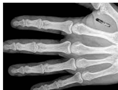
Рис. 2. Рентген руки с чипом. Fig. 2. X-ray of a hand with a chip.