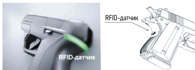
Рис. 6. Пистолет с RFID-датчиком. Fig. 6. Gun with RFID sensor.