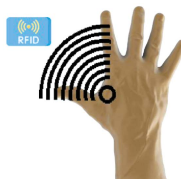
Рис. 3. Взаимодействие чипа и RFID. Fig. 3. Interaction of chip and RFID.