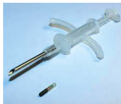
Рис. 1. Имплантация чипа. Fig. 1. Chip implantation.

С 1991 года в Казахстане при исполнении служебных обязанностей погибло более 800 сотрудников правоохранительных органов, более 4,5 тыс. получили ранения разной степени тяжести. Чипирование сотрудников могло бы способствовать их быстрому обнаружению для обеспечения безопасности либо сохранения жизни